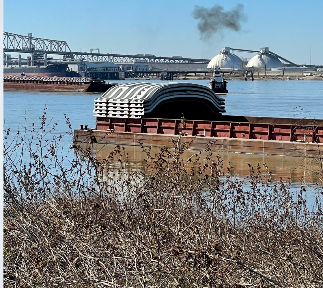
Vue d'une des photographies de la série “Hors Saison” (52x70cm), 2022