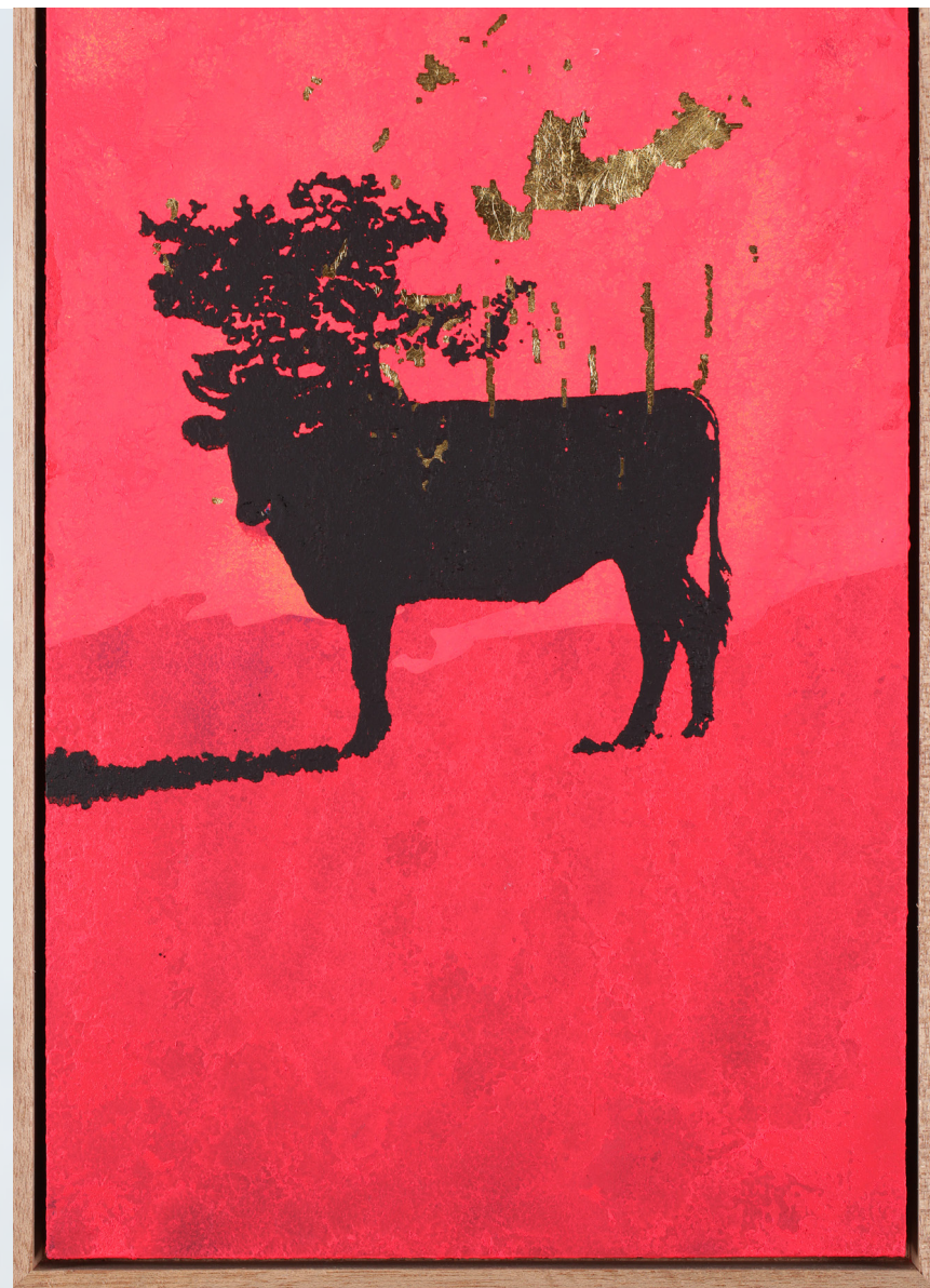
Vues des oeuvres de la série "Les Vaches de Monsieur Yoshizawa" à la Conciergerie (24x40cm), 2017