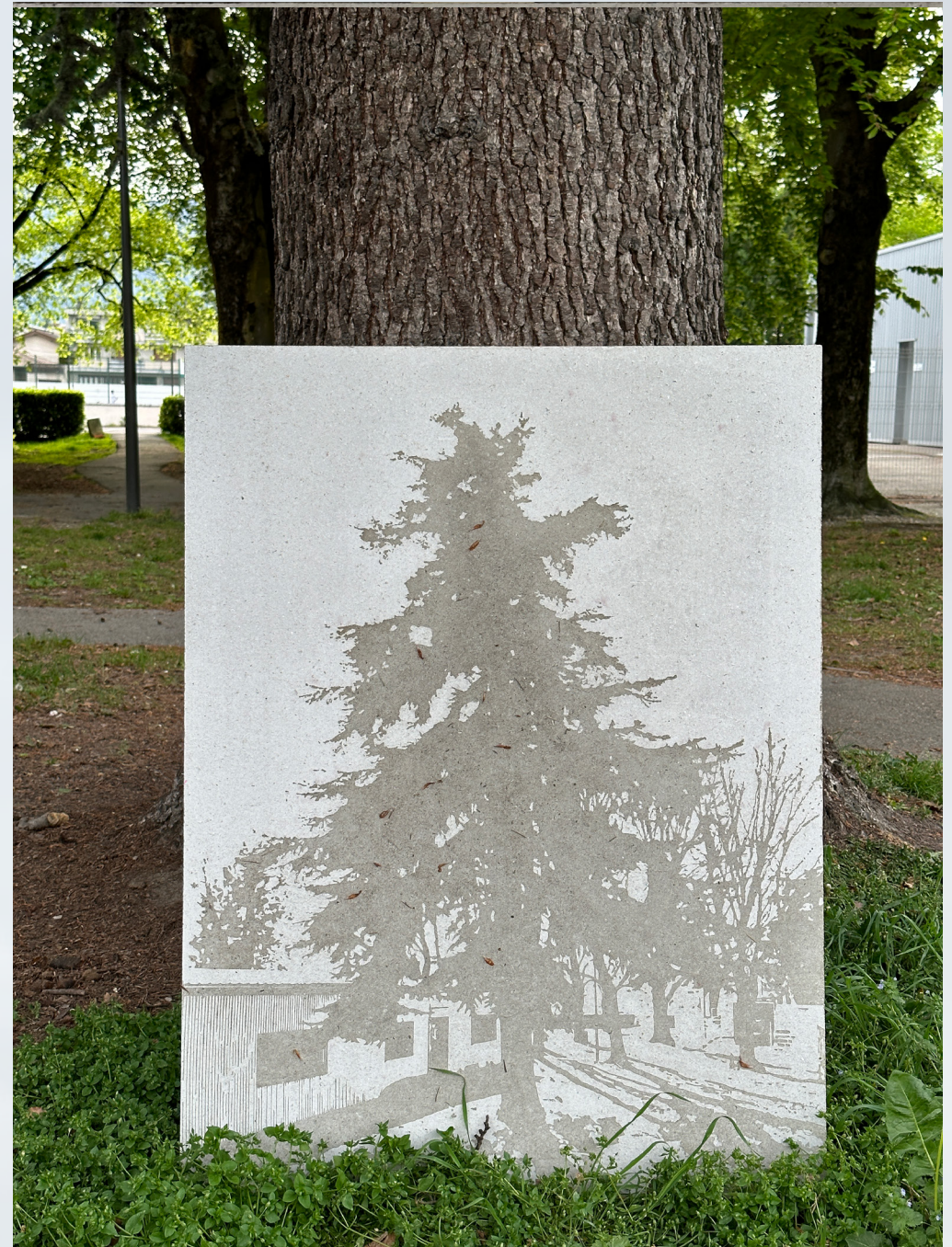
Vue d'une des oeuvres de la série "STRATES" (75x100cm), 2023