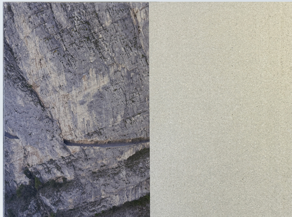
Exemple de portrait de falaise (75x100cm), 2023

les falaises du Vercors à l'aide d'images numériques. Je les ai ensuite utilisées pour créer mes œuvres qui se présentent sous la forme de grandes bandelettes réactives, toujours sur plaques de Fermacell... Elles vont venir capter les nuances