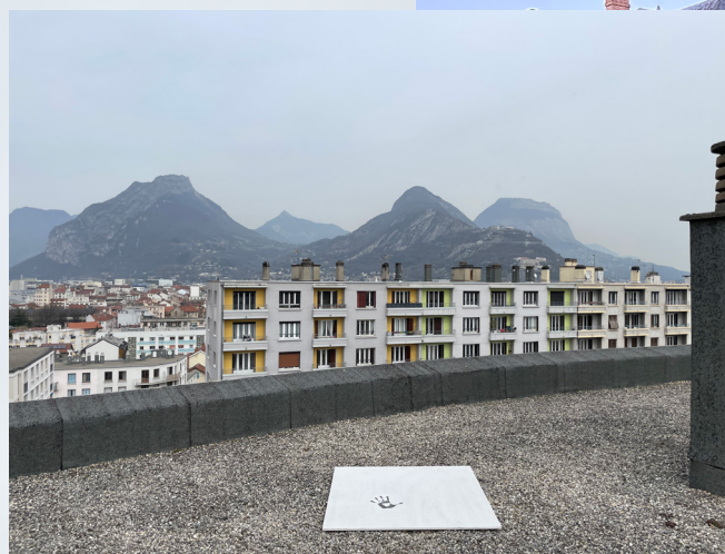
Vue d'une des déposes d'oeuvres In Situ de la série "STRATES", 2022

Pendant quatre semaines, avec les scientifiques, nous avons étudié chaque pochoir sur place. L'analyse scientifique basée sur nos capteurs embarqués que sont nos yeux, nos oreilles, nos nez... (etc) a donc été complétée par un relevé visuel à l'aide d'un film. Des séquences vidéo ont été prises pour capturer la durée de la formation de l'image et des plans plus larges, changeant d'échelle, ont également été réalisés pour refléter l'interaction de l'œuvre avec l'environnement.