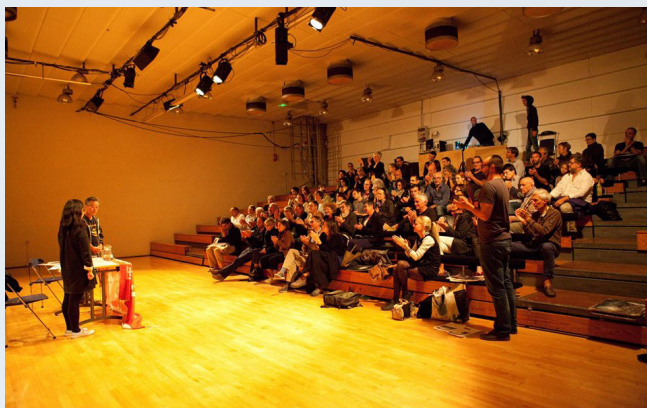
Vue de la conférence au Magasin CNAC à Grenoble, 2017