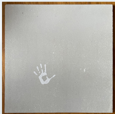
Vue d'une des oeuvres de "STRATES" (100x100cm), 2022

Les trois sites de départ ont simplement été choisis à proximité de 3 stations atmosphériques de la région grenobloise : celle de Catane, celle de l'École des Frênes et celle de Saint Martin d'Hères (cf. image ci-contre).