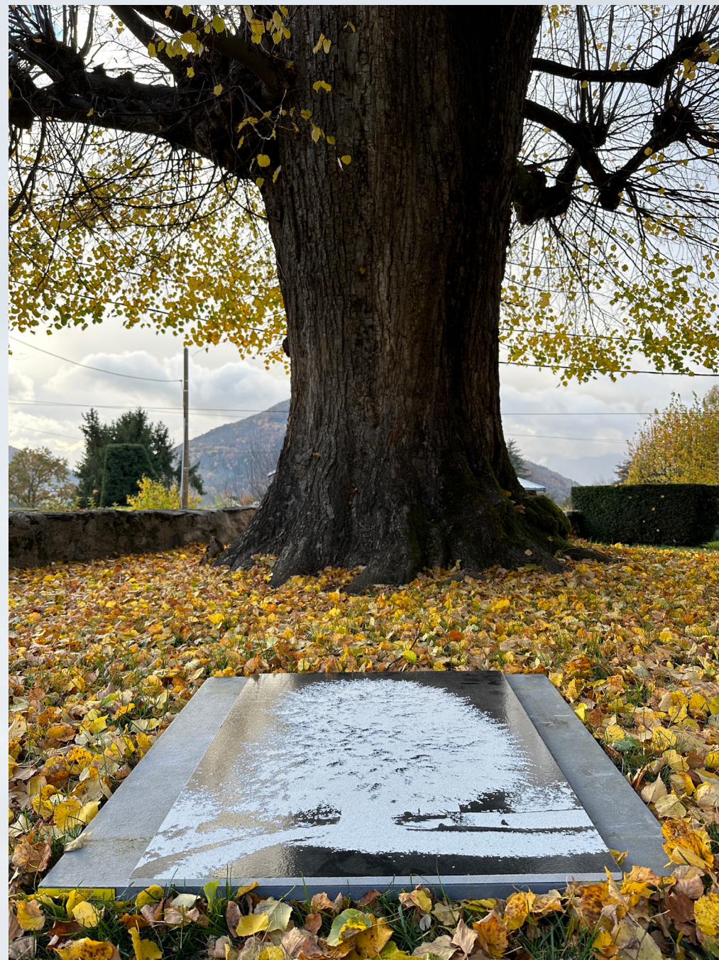
Vue d'une des oeuvres de la série "STRATES" (75x100cm) , 2023

Comme vous pouvez le voir ci-dessus, la première ligne est celle des activités humaines (activités humaines + pratiques agricoles + modes de chauffage + moyens de transport + grands chantiers métropolitains) // Un chantier de démolition d'un pont urbain au centre de Grenoble, un échangeur autoroutier