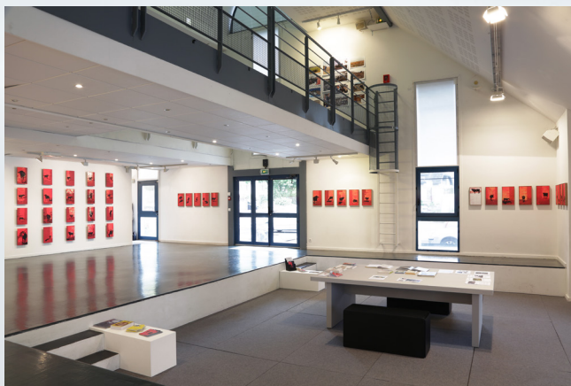
Vue d'une partie de la série LVMY à la Conciergerie, 2017