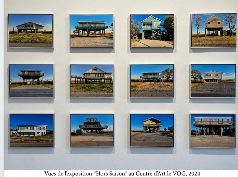
Vues de l'exposition "Hors Saison" au Centre d'Art le VOG, 2024