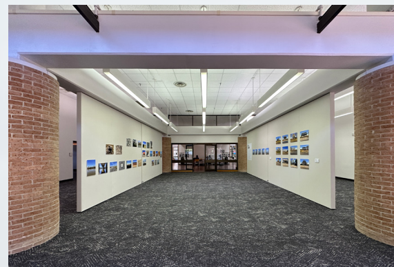
Vue d'une partie de la série «Hors Saison» à la Clark and Laura Boyce Gallery, LSU, États-Unis, 2023

“Right in the heart of winter In between two mosquito outbreaks In between two humid and stifling heatwaves How can one speak about the density of the air? The thickness of the mud inside the house? The wind rising once more? The nine months of BP Horizon? The passing hurricane? The noise of engines? The bereavement to come? What can one experience in between two storms? What specific relationship to air can exist there ?”